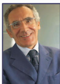
Il Presidente SIUD

Vi porge il suo saluto un Presidente soddisfatto, invitando Soci e altri Colleghi, Aziende ed altre Associazioni, al congresso di Napoli, che sembra proprio essere accattivante, per programma scientifico ed organizzazione, nell'ormai tradizionale formato standard, snello ma completo.